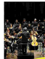
La Young Talents Orchestra EY

Concerto giovedì al Comunale dedicato al progetto "Prendersi cura della vita"